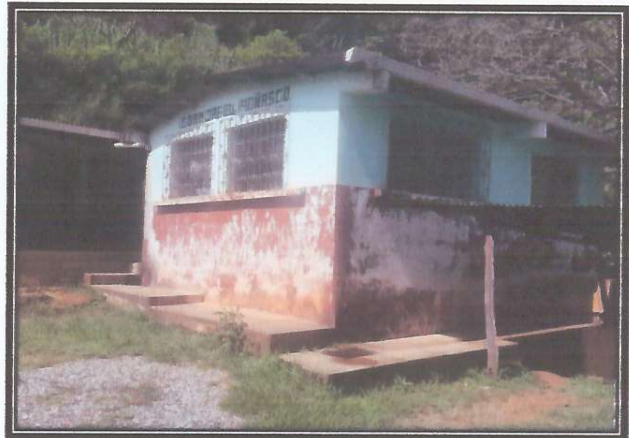
Foto 2: asi se encuentra todos los muros del establecimiento educativo que necesita de mantenimiento de pintura.