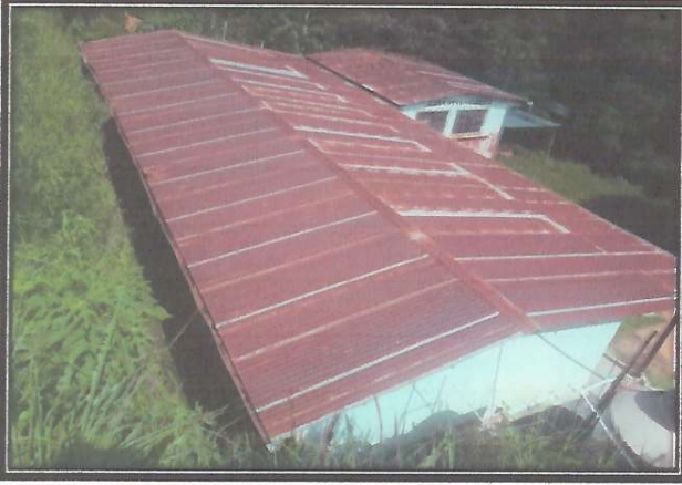
Foto1: area de mantenimiento de la cubierta de lámina que esta dañada.